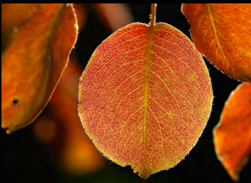
Herbstlich gefärbtes Birnenblatt

Die Bilder können täglich auf der Ebene 1 beim Mitarbeitercasino der BG Klinik, Schnarrenbergstraße 95, Tübingen betrachtet werden.