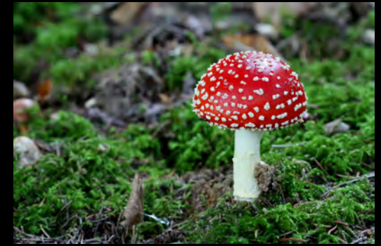
Fliegenpilz ( Amanita muscaria )