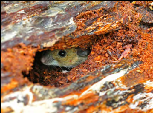
Waldmaus ( Apodemus sylvaticus )