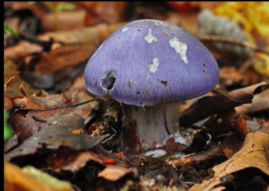
Blauer Klumpfuß ( Cortinarius caerulescens )