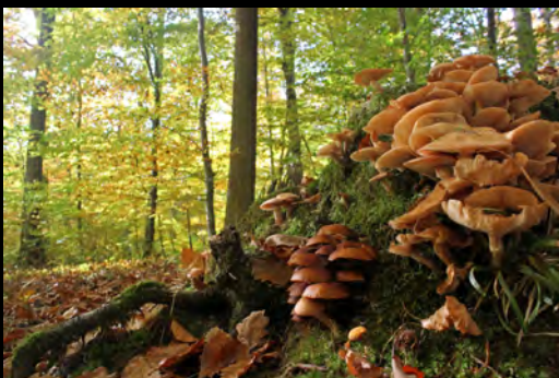
Pilze im Wald

Die Waldmaus lebt in lichten Wäldern und an Waldsäumen. Im Herbst füllt sie ihre unterirdische Vorratskammer mit Eicheln, Bucheckern und Haselnüssen, Pilze verspeist sie lieber gleich.